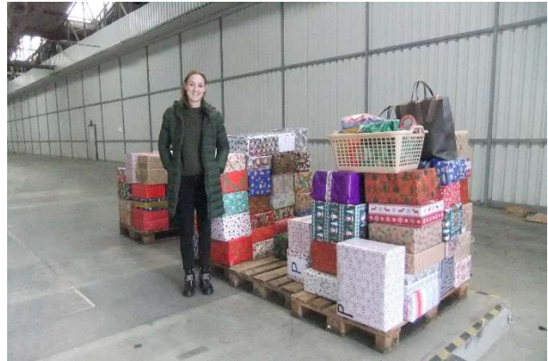
Die Mitarbeiter Aurelis Real Estate Service GmbH beteiligten sich an der Aktion