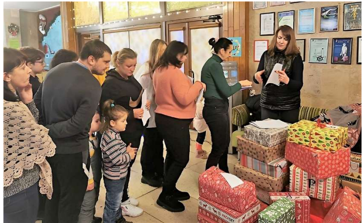
Verteilung der Weihnachtspäckchen durch den Allukrainischen Verband der Binnenvertriebenen in Rivne