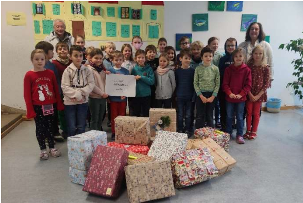
Die Klassen der Limeschule in Aubing machten mit