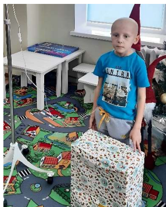
Verteilung der Päckchen durch den Binnenvertriebenenverband sowie in der Kinderonkologie in Rivne