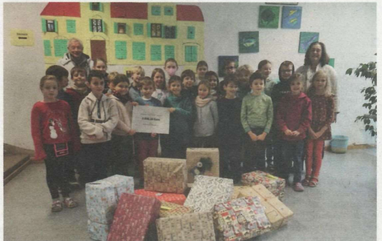
Schüler, Eltern und Lehrer sammelten fleißig Sachspenden.