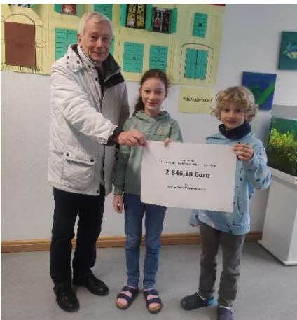
Der Förderverein der Limeschule spendete über 2800 Euro