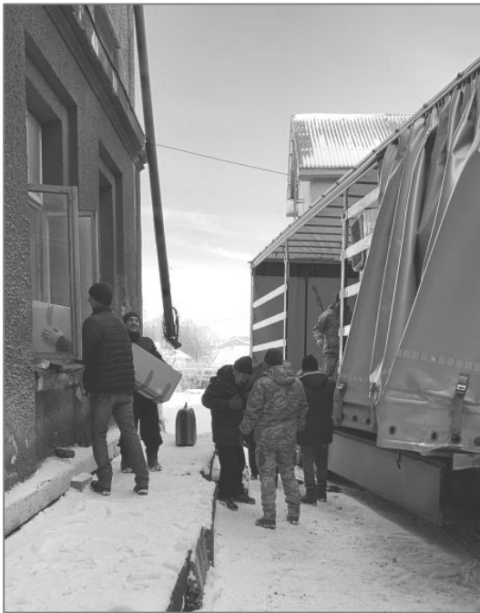
Entladen des Lkws in Chodoriw