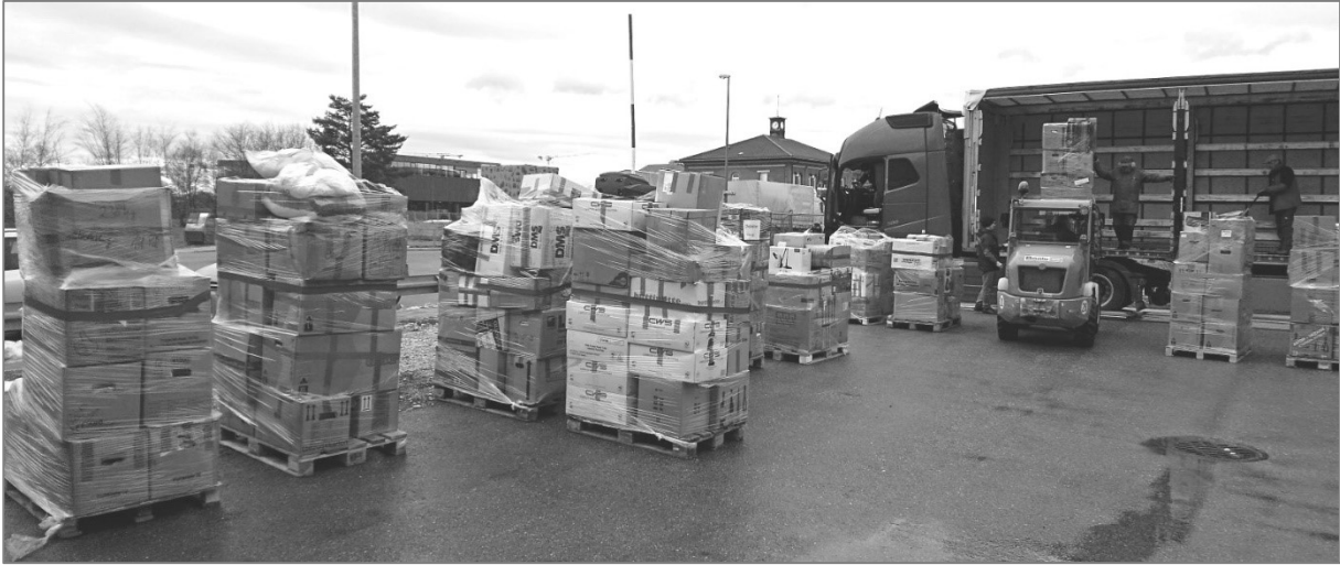
Beladen des Lkws in Aubing