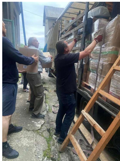
Ankunft in Turka: Der Lkw wird auf dem Gelände des Internats entladen.