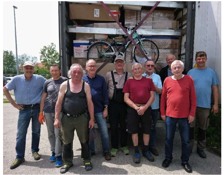
Der Stapler muss noch nachhelfen, damit die Lkw-Türe schließt. Unser Beladeteam hat es wieder geschafft.