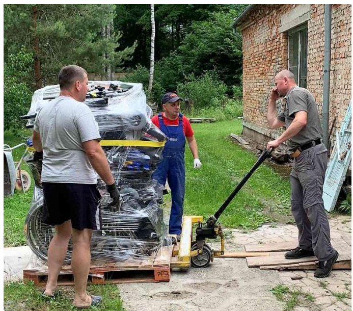
Ankunft in Rivne: Auf der Palette sind Rollstühle, Rollatoren und Gehhilfen.