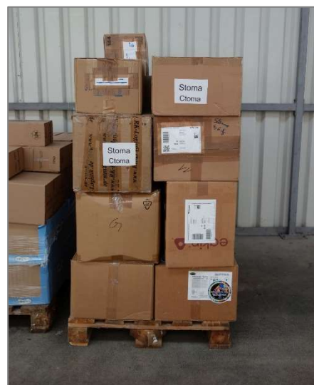
Verladen der Stomaartikel