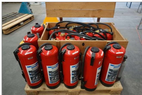
Verladen der Feuerlöscher