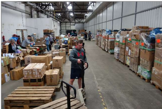
Sammelaktion am 21.09.2024