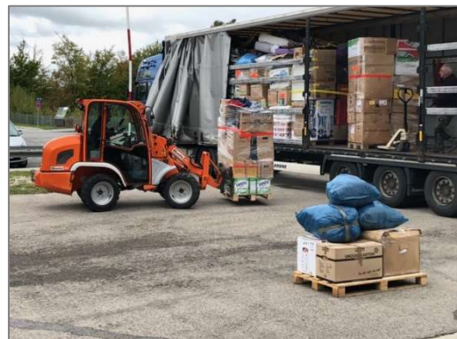
Beladen des Lkw am 28.09.2024